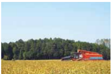
そばが緑のうちにコンバインで刈り取る風景

農作物の栽培が安定してくると、地域が抱える様々な問題が見えてきました。後継者が減り、休耕田が目